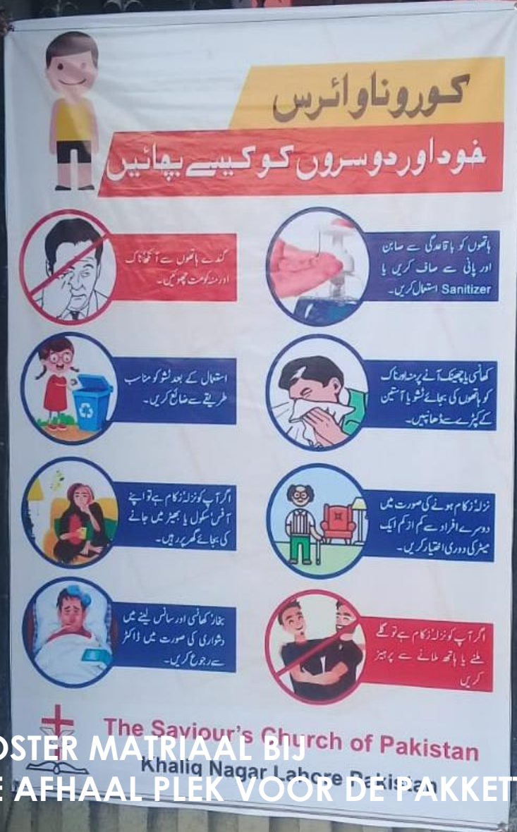
POSTER MTRIAAL BIJ DE AFHAAL PLEK VOOR DE PAKKETTEN

Naast het verstrekken van voedselpakketten is een ander onderdeel het voorlichten van de mensen over hygiëne en het bewaren van afstand. Hiertoe is postermateriaal gemaakt, waarbij ook met symbolen wordt uitgelegd wat men moet doen. Omdat het analfabetisme groot is, moet ook veel uitgelegd worden.