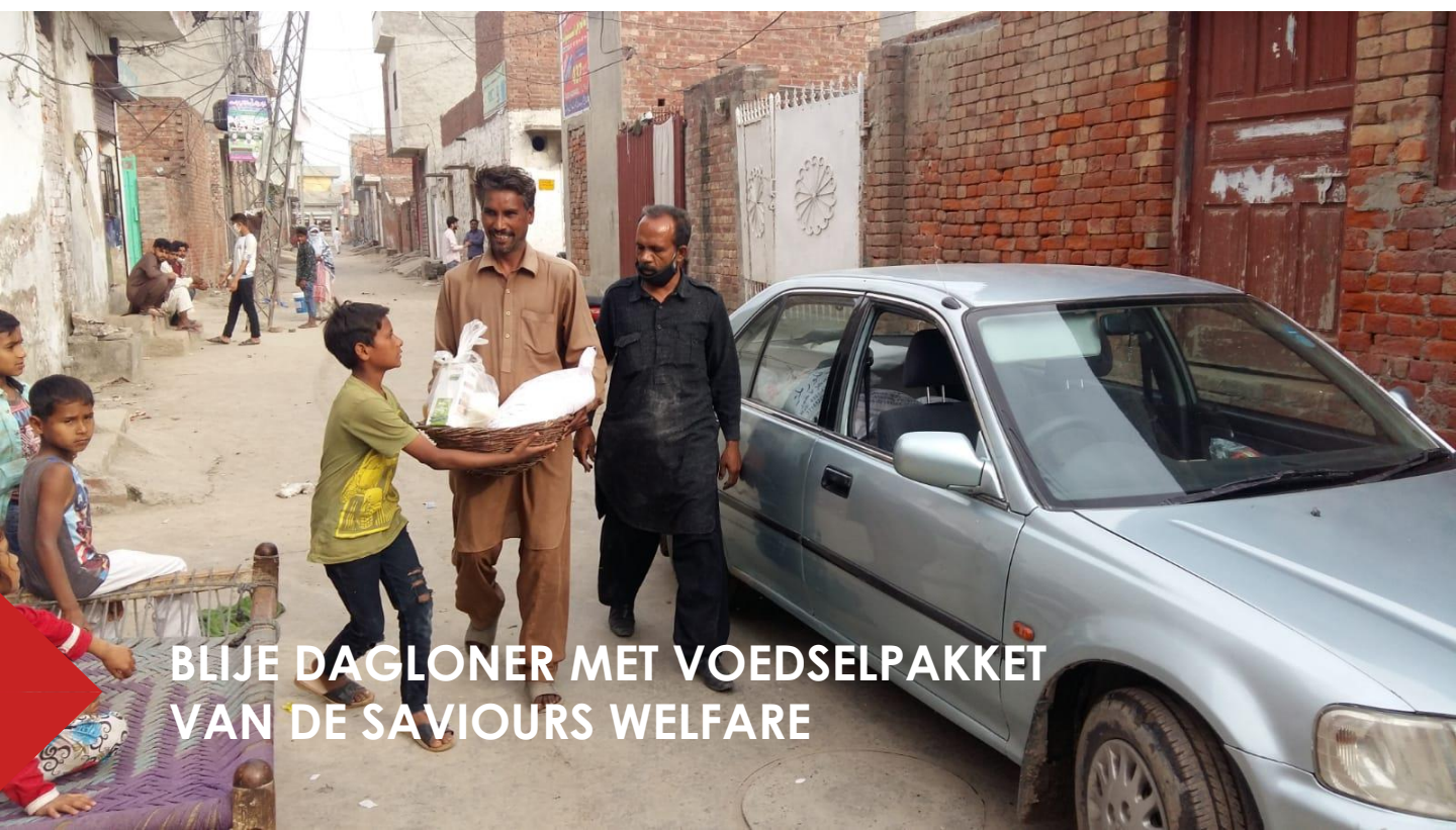
BLIJE DAGLONER MET VOEDSELPAKKET VAN DE SAVIOURS WELFARE

Hiermee kunnen we ook in de komende weken nog blijven helpen.