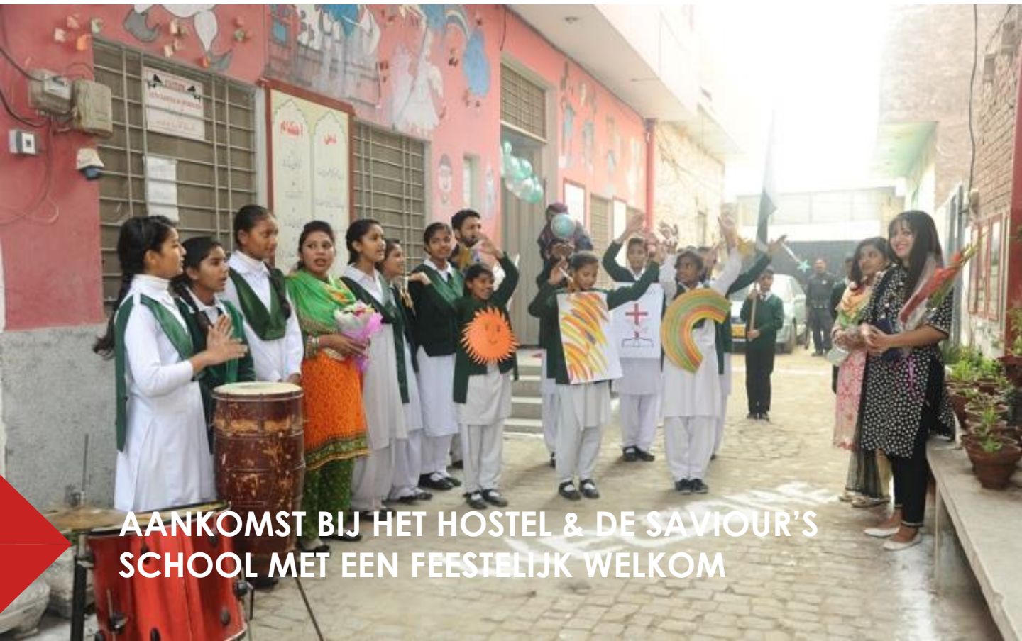
AANKOMST BIJ HET HOSTEL & DE SAVIOUR'S SCHOOL MET EEN FEESTELIJK WELKOM

Tijdens ons bezoek vertelden ze wat over zichzelf, hun thuissituatie en hoe het gaat op school. Sommigen zijn vrijmoedig om van alles te vertellen, anderen volgen schoorvoetend. Ze zongen uit volle borst liedjes in het Urdu. Het was een heel mooi moment om deze kinderen met hun begeleiders te ontmoeten. Natuurlijk missen ze hun ouders wel, maar er is geen andere mogelijkheid. De ouders bezoeken hun kinderen geregeld. Ze komen met de bus naar KN. De meeste ouders proberen om elke zondag de kerkdienst bij te wonen en daarna een paar uurtjes door te brengen met hun kinderen. Zo hoeven ze niet van elkaar te vervreemden.