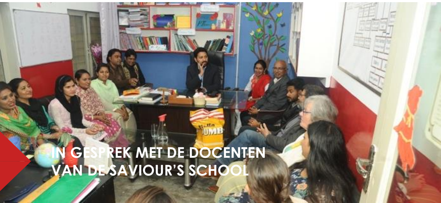
IN GESPREK MET DE DOCENTEN VAN DE SAVIOUR'S SCHOOL

Het onderwijs staat op hoog niveau en voldoet ruimschoots aan de officiële eisen. Oxfordniveau.