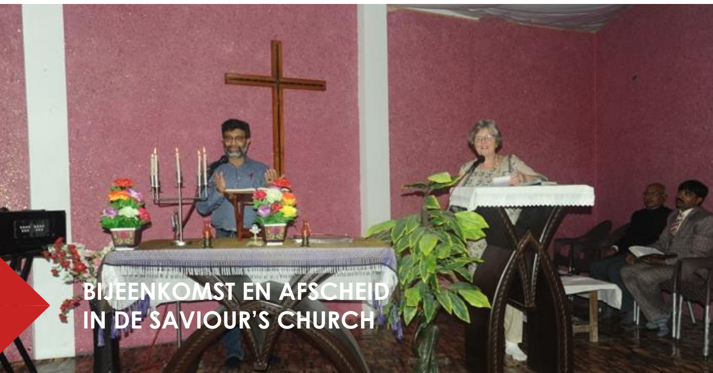
BIJeenkomst en afscheid in de Saviour's Church

Er werd nog een dansje uitgevoerd en men wist dat ik binnenkort jarig zou zijn. Daarom hadden ze een mooie taart met 2 kaarsjes gekocht en werd ik hartelijk toegezongen in het Urdu. Ik was er ontroerd door en pinkte enkele tranen weg vanwege het naderend afscheid. Tranen van blijdschap om de hartelijke en warme ontvangst maar ook een beetje verdrietig om de mensen in de sloppenwijk achter te moeten laten. Misschien vanwege een voorgevoel van de Coronacrisis die vrij snel daarna ook in Khaliq Nagar zich openbaarde.