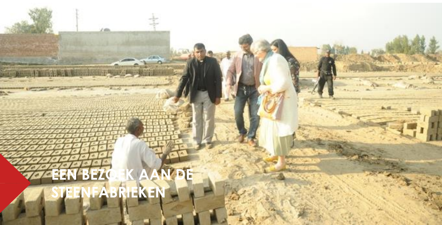
EEN BEZOEK AAN DE STEENFABRIEKEN

De werkers hebben vaak schulden bij de baas van de fabriek omdat ze van zo weinig geld niet rond kunnen komen. Het nadeel van die schulden is dat ze daarmee ook minder inkomen krijgen. Mensen met schulden krijgen namelijk 900 roepies voor 1000 stenen in plaats van 1200 roepies. Bij minder stenen is dat bedrag nog lager. Het is met recht slavenwerk. Vaak helpt het hele gezin mee. Soms al vanaf 5 jaar oud.